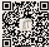
研究生迎新 微信公众平台