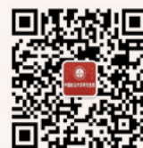
研究生院 微信公众平台