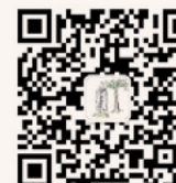
研究生迎新 微信公众平台