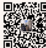
研招办 微信公众平台