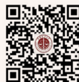
中国政法大学 微信公众平台